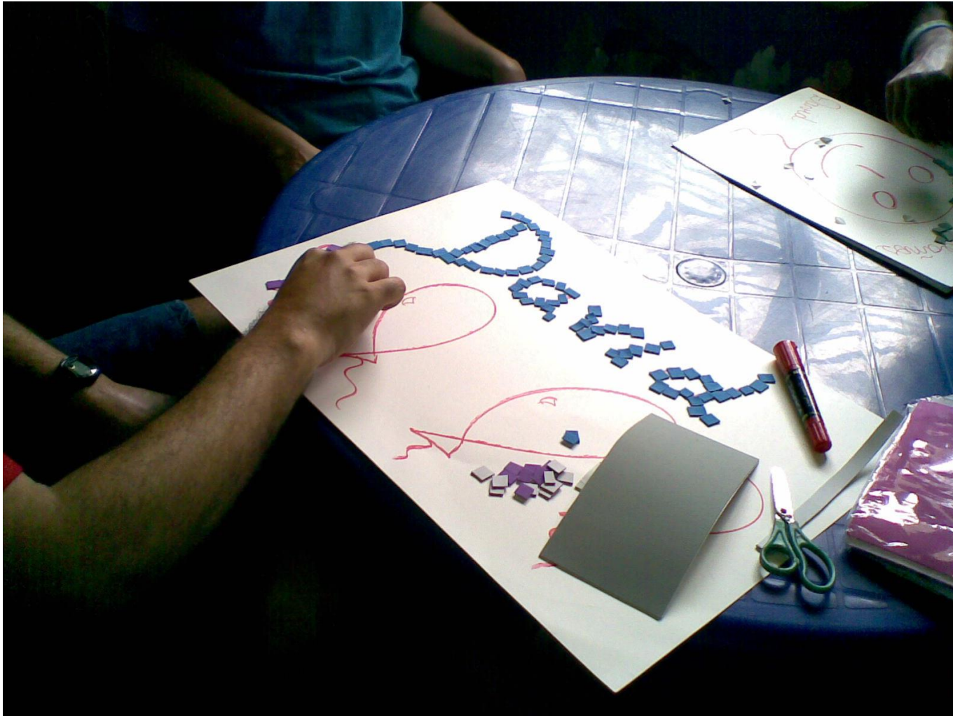
MAGISTRA SONIA TROTMAN, 2011