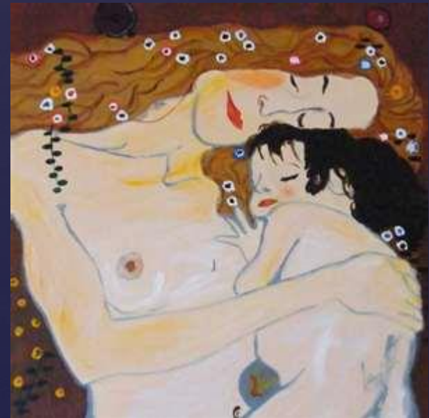
Klimt, "La mère et l'enfant".