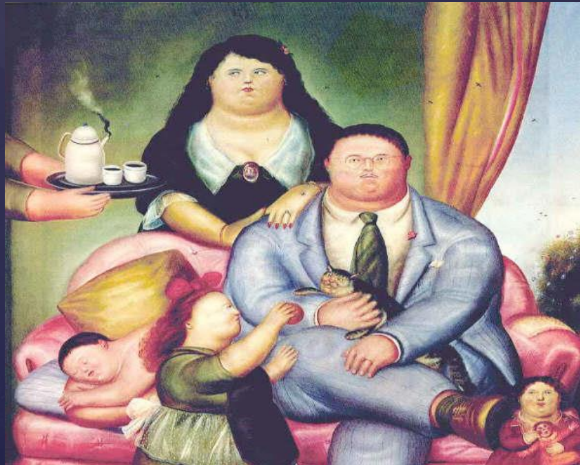
La familia, Botero