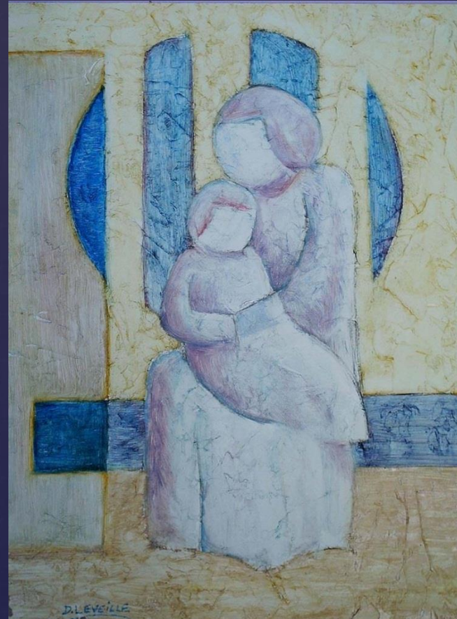
Cuadro Madre e hijo no clasificado

La pregunta de la madre: “¿Que tiene mi hijo?” “¿Que le esta pasando?”